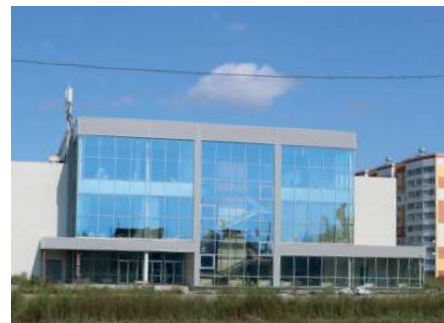
ФОК «Позитрон» летом 2019 года

Уникальность сарапульского спортивного центра заключается в размещении множества площадок в одном месте. В ходе планировки были учтены все пожелания и замечания из «народного чата», участниками которого в том числе были и активисты АО «Элеконд». На четырех этажах комплекса разместятся многофункциональный игровой спортивный зал, 25-метровый бассейн на пять дорожек и маленькая чаша для грудничков и детей постарше, тренажерный зал, зал единоборств для занятий силовыми видами спорта, залы аэробики для групповых и индивидуальных занятий различными видами ритмических тренировок и