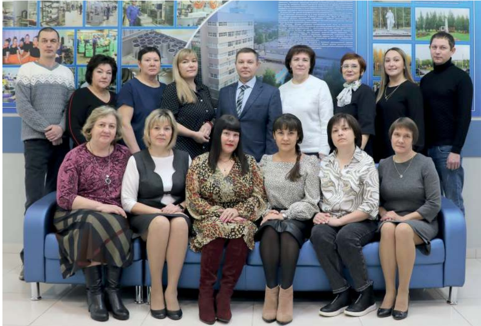
Коллектив отдела технической документации, декабрь 2022 года