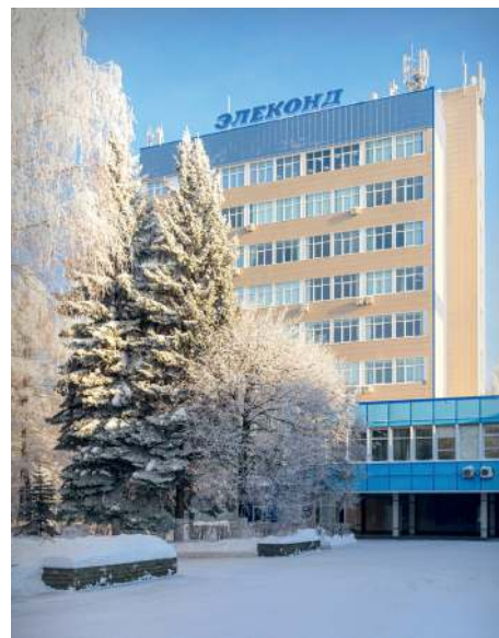
Современный облик административно-лабораторного корпуса, 2022 год

Обитатели верхних этажей не являются исключением. Выше их рабочих кабинетов - только мечты и надежды на будущее, да бездонное небо, меняющее свои очертания с каждым мгновением. Работникам восьмого и девятого этажей повезло. Им сверху видно все. Например, живописные виды уходящих за горизонт окрестностей. В минуты отдыха многие успевают поймать в фотообъектив неповторимые мгновения меняющихся пейзажей за окном. Отрадно, что в недавнее время в лабораторном корпусе произведена замена всех окон на современные конструкции, которые привнесли в жизнь «незамутненность зрения» и комфортность эксплуатации.